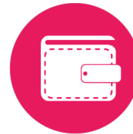
Les documents et argent