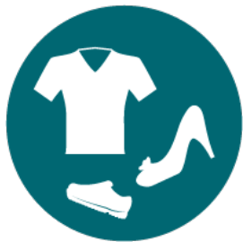
Les vêtements et chaussures