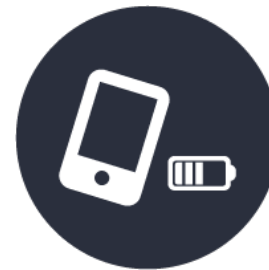
Les accessoires divers