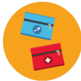
Les trousse de toilette et de pharmacie