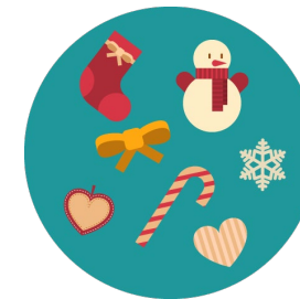
Des petites boules et autres sujets décoratifs