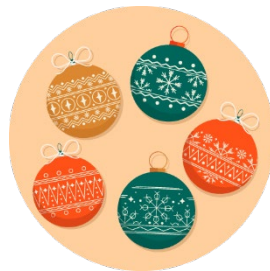
Des grosses boules